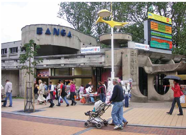
10 pav. Kavinė „Banga“, J. Basanavičiaus g. 2, archit. G. J. Telksnys, projektuotas 1976–1977 m., įgyvendintas 1979 m.