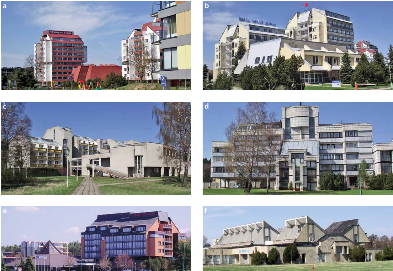
3 pav. Vanagupės kurortas, archit. A. Lėckas, urbanistinis projektas 1967 m., 1982 m.:

a) Poilsio namai „Linas“, Vytauto g. 155, archit. A. Lėckas, 1975 m.; b) Reabilitacijos ligoninė (buvusi jūrininkų poilsio bazė), Vytauto g. 153, archit. A. Lėckas, 1975 m.; c) Sanatorija „Žvorūnė“, Vanagupės g. 15, proj. archit. L. Merkinas, 1978–1981 m., įgyv. 1989 m.; d) Poilsio namai „Rugelis“, Vanagupės g. 13, archit. S. Šarkinas, 1980–1984 m.; e) Viešbutis „Vanagupė“, Vanagupės g. 31, archit. A. Lėckas, rekonstrukcijos archit. D. Dainius, K. Mikšys, A. Sinas ir N. Sirutienė, 2003 m.; f) „Lino“ baseinas, Vanagupės g. 40, archit. A. Lėckas, S. Šarkinas, L. Merkinas, 1984 m.