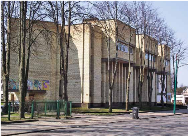
1 pav. Muzikos mokykla, Maironio g. 8, archit. I. Likšienė, 1981 m.

Fig. 1. The music school, Maironio g. 8 archit. I. Likšienė, 1981