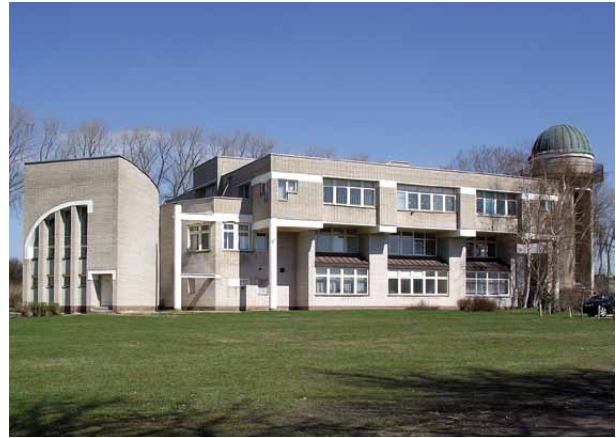
2 pav. Pradinė mokykla, Virbališkės takas 4, archit. I. Likšienė, G. P. Likša, 1985 m.

Fig. 1. The music school, Maironio g. 8 archit. I. Likšienė, 1981