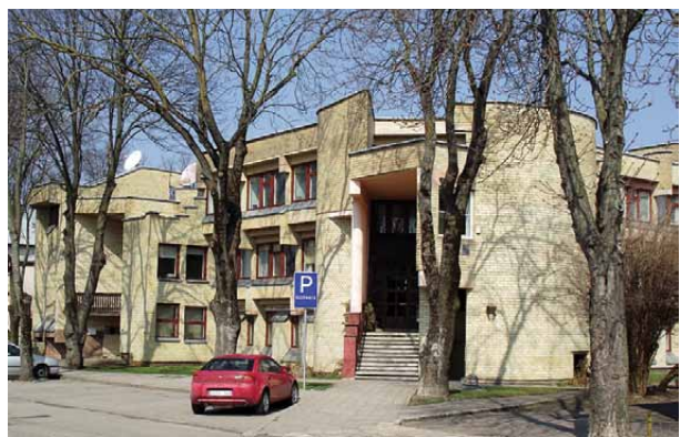
6 pav. Komprojekto gamybinis pastatas su bendrabučiu, Gintaro g. 30, 30A, archit. I. Likšienė, G. P. Likša, 1988 m.

Fig. 5. The Rąžė bookshop and café building, Vytauto g. 84, archit. R. V. Kraniauskas, 1967