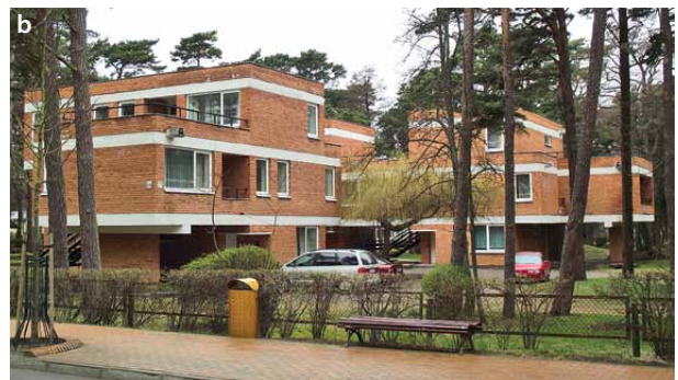
4 pav. Viešbutis „Žilvinas“, Kęstučio g. 34, archit. A. Lėckas, 1968 m. (a); „Žilvinėlio“ apartamentai, Birutės al. 44, archit. A. Lėckas, 1970 m. (b).