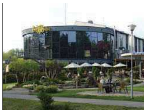
9, 10 pav. Restoranas „Vasara“ Palangoje (arch. A. Eigirdas) 1964 m. ir dabar (9 pav. paimtas iš Švyturys, 1966 m. gegužės 9 d.; 10 pav. nuotrauka A. Gabrėno)