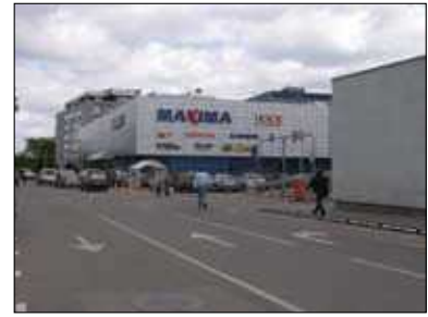
15, 16 pav. Baldų parduotuvės paviljono pastatas Vilniuje (arch. E. N. Bučiūtė) 1974 m.; rekonstruotas 1990 m. (15 pav. paimtas iš Statyba ir architektūra , 1968/6; 16 pav. nuotrauka autorės)

Figs. 15, 16. Furniture Store Pavilion in Vilnius (arch. E. N. Bučiūtė) in 1974 reconstructed in 1990