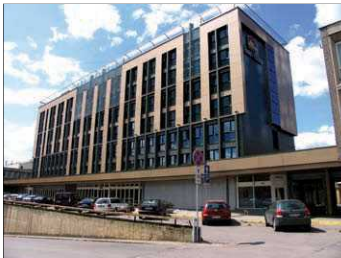
7, 8 pav. Viešbutis „Turistas“ Vilniuje (arch. J. Šeibokas) 1978 m. ir dabar (7 pav. paimtas iš katalogo Vilnius . Vilnius: Mintis, 1980; 8 pav. nuotrauka autorės)