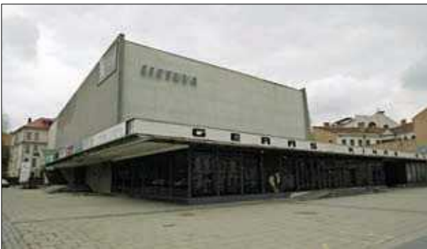
20 pav. Kino teatras „Lietuva“ Vilniuje (arch. J. Kasperavičius) 1959–1965 m.