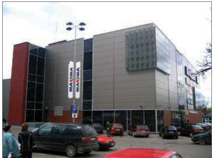
13, 14 pav. Baldų parduotuvė „Klevas“ Panevėžyje (arch. N. Grabliauskienė) 1970 m. ir dabar (13 pav. paimtas iš L. Skrebė. Panevėžys . Vilnius: Mintis, 1984; 14 pav. nuotrauka I. Račkausko)

Figs. 13, 14. Furniture Store “Klevas” in Panevėžys (arch. N. Grabliauskienė) in 1970 and 2008