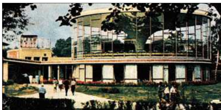
Figs. 7, 8. Hotel “Turistas” in Vilnius (arch. J. Šeibokas) in 1978 and 2008