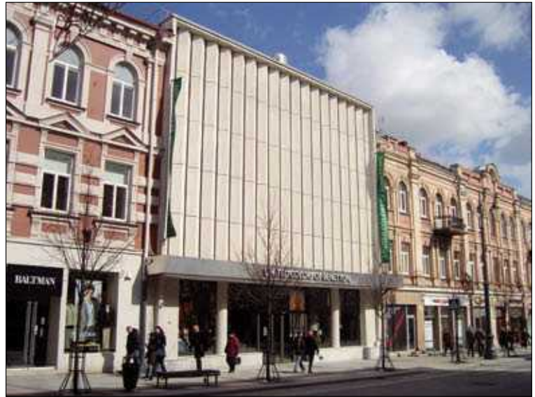
3, 4 pav. Kino teatras „Vilnius“ Vilniuje (arch. J. Kasperavičius, C. Strimaitis) 1963 m. ir dabar (3 pav. paimtas iš J. Minkevičius. Architecture of the soviet Lithuania . Maskva: Stroiizdat, 1987; 4 pav. nuotrauka G. Ilgūno)

Figs. 3, 4. Cinema "Vilnius" in Vilnius (arch. J. Kasperavičius, C. Strimaitis) in 1963 and 2008