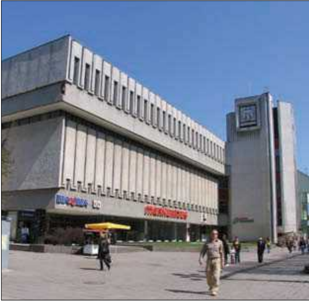
18 pav. Parduotuvė „Merkurijus“ Kaune (arch. A. Sprindys) 1982 m.