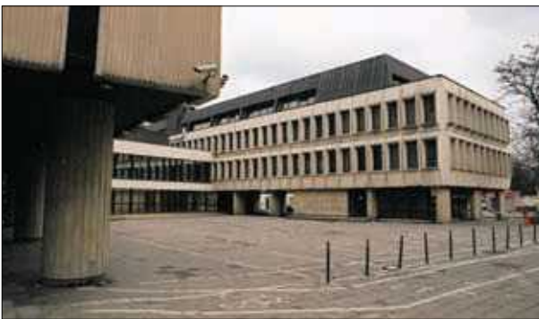
19 pav. Ryšių ministerijos objektų kompleksas (arch. J. Šeibokas) 1978–1979 m.