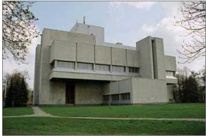
1, 2 pav. Sporto ir pramogų rūmai Vilniuje (arch. A. Mačiulis) 1983 m. ir dabar (1 pav. paimtas iš J. Minkevičius. Architecture of the soviet Lithuania . Maskva: Stroiizdat, 1987; 2 pav. nuotrauka G. Ilgūno) Figs. 1, 2. Sports and Entertainment Palace in Vilnius (arch. A. Mačiulis) in 1983 and 2008

riniai ir išskiriami praradimai, kurie suvokiami fizine prasme – kaip objektų transformacijos, renovuojant, rekonstruojant ar kitaip keičiant pradinį pavidalą. Analizuojant Lietuvos modernizmo architektūros būklę, t. y. originalią pastatų išvaizdą lyginant su dabartine, didžiausi pokyčiai suskirstyti į keletą grupių, apie kurias ir kalbama šiame straipsnyje. Pateikiami tik kai kurie – būdingiausi pavyzdžiai, leidžiantys padaryti išvadą apie esamą padėtį. Jie turėtų iliustruoti esamą Lietuvos sovietmečio modernizmo architektūros būklę ir implikuoti tolesnio elgesio su ja sprendimus, kurie liečia ne tik konkrečių pastatų paveldo sąrašus, bet ir vertingųjų savybių apsaugos ir elgesio su jomis gaires.