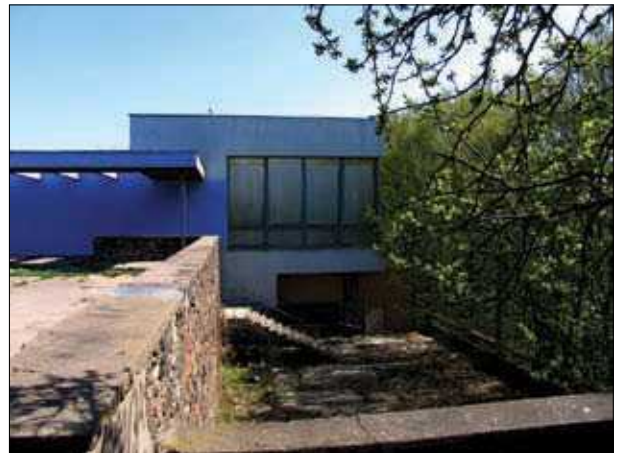
5, 6 pav. Kavinė „Trys mergelės“ Kaune (arch. A. and V. Jakučiūnai) 1967 m. ir dabar (5 pav. paimtas iš Lietuvos architektai/LAS . Vilnius: Lietuvos dailės akademijos leidykla, 2000; 6 pav. nuotrauka autorės)

Figs. 5, 6. Cafe "Trys mergelės" in Kaunas (arch. A. and V. Jakučiūnai) in 1967 and 2008