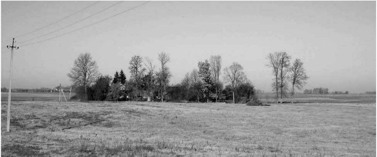
2 pav. Tradicinės vienkietinės sodybos yra neatskiriama etnografinių šalies regionų kaimo gyvenamųjų vietovių sistemos dalis. Užnemunės krašto (Suvalkijos regiono) etnografinė vienkietinė sodyba

Fig 2. Traditional steadings are inseparable part of rural settlement system of country's ethnographic regions. Ethnographic steadings of Sudovia region