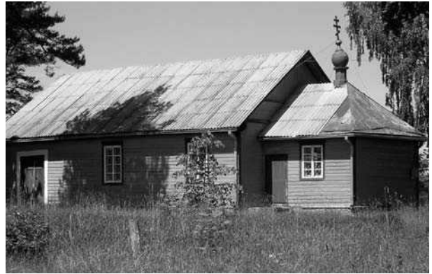
5 pav. Sentikių cerkvė Kruonio miestelyje Kaišiadorių rajone – tautinių mažumų sakralinio paveldo pavyzdys. Šis paveldas dažniausiai aptinkamas istoriniuose Lietuvos miesteliuose

Siekiant spręsti užimtumo, ypač ilgalaikio nedarbo, problemas kaimo gyvenamosiose vietovėse, svarbu ieškoti alternatyvių žemės ūkiui ekonominės veiklos rū-