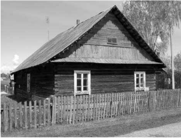
6 pav. Dzūkiska viengalė pirkia Dubičių miestelyje, Varėnos rajone – etnografinių sodybų paveldo pavyzdys

Fig 6. One-sided house of Dzūkija ethnographic region in Dubičiai town, Varėna district is an example of traditional housing in rural settlements