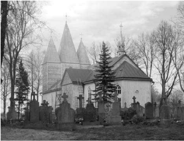
4 pav. Švč. Trejybės bažnyčia Alėjų bažnytkaimyje, Raseinių rajone – sakralinio paveldo, išlikusio istorinėse kaimo gyvenamosiose vietovėse, pavyzdys

Fig 4. Holy Trinity Church in Alėjai village, Raseiniai district is an example of sacral cultural heritage extant in historic rural settlements