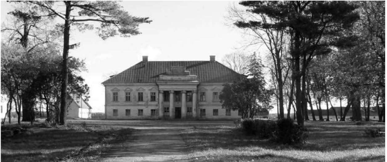
3 pav. Buvusių dvarų sodybos – reikšminga kaimo gyvenamųjų vietovių kultūros paveldo dalis. Buvusio Žeimiių dvaro sodyba Žeimiių miestelyje, Jonavos rajone

Fig 3. Manor residences are significant elements of cultural heritage of country's rural settlements. Žeimiai manor residence in Žeimiai town, Jonava district