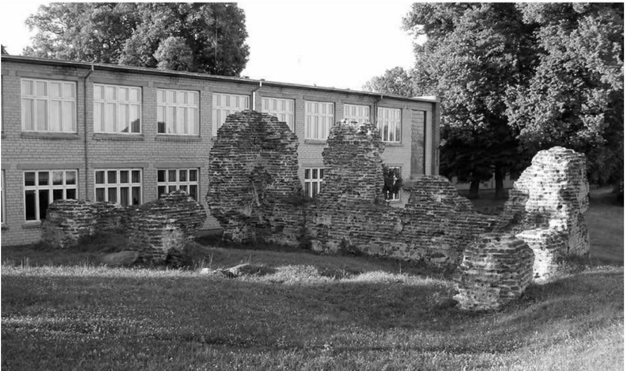
7 pav. Kruonio piliavietė Kruonio miestelyje, Kaišiadorių rajone – archeologinio kaimo gyvenamųjų vietovių paveldo pavyzdys

technologijos universiteto Statybos ir architektūros fakulteto Kraštotvarkos centro atliekamų kaimo gyvenamųjų vietovių nekilnojamojo kultūros paveldo tyrimų bei Nacionalinėje turizmo plėtros programoje pateiktais duomenimis, galima teigti, kad vienos pagrindinių priežasčių, stabdančių kultūrinio turizmo plėtrą, yra bloga nekilnojamojo kultūros paveldo objektų būklė ir viešosios turizmo infrastruktūros trūkumas [16, 35]. Visgi daugelis kaimo gyvenamosiose vietovėse esančių istorinių statinių ir pastatų gali tapti kultūrinio turizmo objektais, o kai kuriuos iš jų galima pritaikyti ir naudoti kaip turizmo infrastruktūros elementus. Pavyzdžiui, buvusių dvarų sodybos gali būti pritaikomos ne tik ekspozicinei paskirčiai, bet ir apgyvendinimo ar konferencijų turizmo, kurio poreikis šalyje bei regione auga, reikmėms. Vienkieminės sodybos, atsižvelgiant į jų vertę bei aplinką, gali būti pritaikomos ne tik kaimo, bet ir kultūrinio turizmo reikmėms. Siekiant išvengti per didelės turistų koncentracijos ir jos daromos žalos reikšmingiausiuose nekilnojamojo kultūros paveldo objektuose bei panaudoti šalies turistinį potencialą, siūloma kurti ir populiarinti kultūrinio turizmo maršrutus, apimančius įvairias kaimo gyvenamosiose vietovėse esančio kultūros paveldo kategorijas. Šiuo metu turizmo informacijos centrai užsienio ir vietos turistams