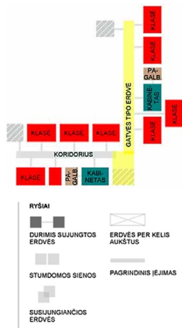
1 pav. P. Vileišio progimnazijos schema ir erdvių ryšius nurodanti eksplikacija

Muziejaus pavyzdį atitinka „Minties“ gimnazija (2 pav.). Viena vertus, mokykla yra gana klaidi, tačiau stebinanti savo persipinančiomis erdvėmis. Mokykla