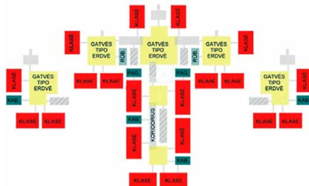
2 pav. „Minties“ gimnazijos schema Fig. 2. Scheme of “Mintis” gymnasium

suprojektuota taip, kad beveik visos patalpos yra apšviestos arba pro langus, arba pro įrengtus stoglangius. Taip siekiama į mokyklos erdves įsileisti kuo daugiau natūralios šviesos. Kitaip nei P. Vileišio progimnazijoje, šioje mokykloje rekreacinė aplinka pasižymi erdvumu dėl savo formos, kuri, kitaip nei išilginiai koridoriai, suteikia judėjimo laisvę. Pasak Yi-Fu Tuan (2003), būtent erdvumas yra susijęs su laisve. Nors laisvė gali būti apibrėžiama kelias aspektais, būtent analizuojant erdvę laisvė – tai galimybė judėti. Pats judėjimas savaime nėra tikslas, tačiau tai galimybė ir galia veikti erdvėje be apribojimų. Bet koks judėjimas suponuoja galimybes pažinti erdves ir vietas, o laisvės apribojimas veiklos erdvėje yra reikšmingas tuo, jog riboja veiklą ir tiesioginį pažinimą.