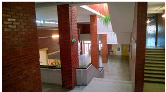
3 pav. „Minties“ gimnazijos interjeras Fig. 3. Interior of “Mintis” gymnasium

Kinestetinis erdvės pažinimas japonų kultūroje taikomas jau labai seniai. Ankstyvieji japoniškų sodų kūrėjai