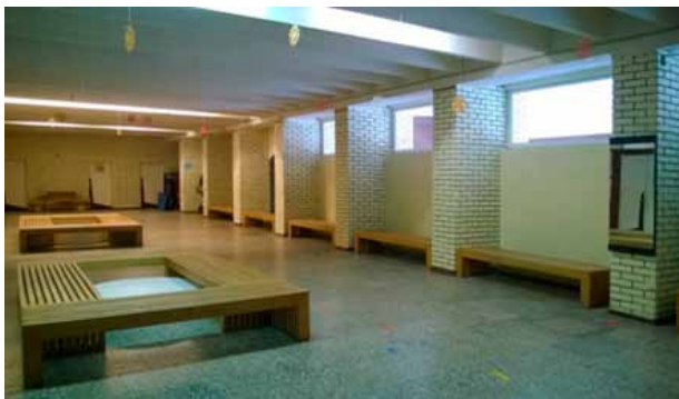
4 pav. S. Daukanto progimnazijos interjeras Fig. 4. Interior of S. Daukantas progymnasium

E. Hall teigimu, lytėjimo ir regėjimo patirtys yra tokios susijusios, kad jų atskirti beveik neįmanoma. Vienas garsiausių XX a. prancūzų menininkų George Braque komentuodamas erdvės suvokimą atskyrė vizualinį ir taktilinį erdvės pažinimą. Menininkas teigė, kad lytėjimo erdvė atskiria stebėtoją nuo objektų, o vizualinė erdvė atskiria objektus nuo kitų (Hall 1990). J. J. Gibson (2014) regėjimą taip pat susiejo su lytėjimu. Jis teigė, kad jeigu mes suvokiame iš karto du informacijos kanalus, kuriuose objektai yra aktyviai tyrinėjami abiem pojūčiais, tuomet išpūdžių srautas yra sustiprinamas. Tekstūra, nors ir vizualiai pateikta, labiausiai įvertinama tik palietus paviršių, todėl ji gali būti labai informatyvi. Pasak E. Hall (1990), kiekvienas paviršius nurodo tam tikrą žinią, kurią žmogus nori perduoti.